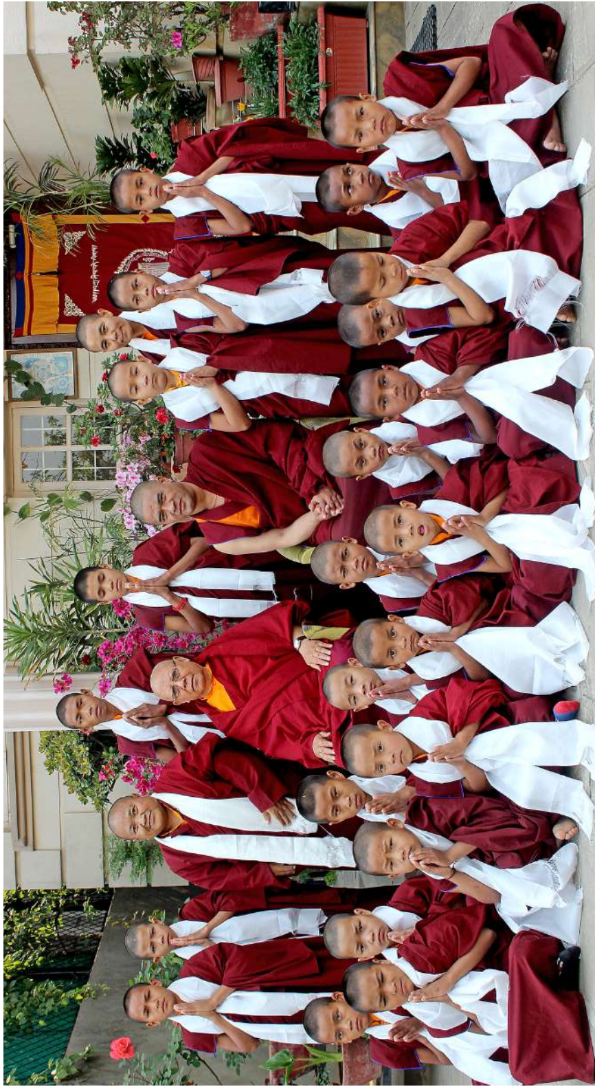
Dharma Students of Khenpo Pema Choephel Foundation graced by the Presence of His Eminence Kyabje Rigo Tulku Rinpoche.