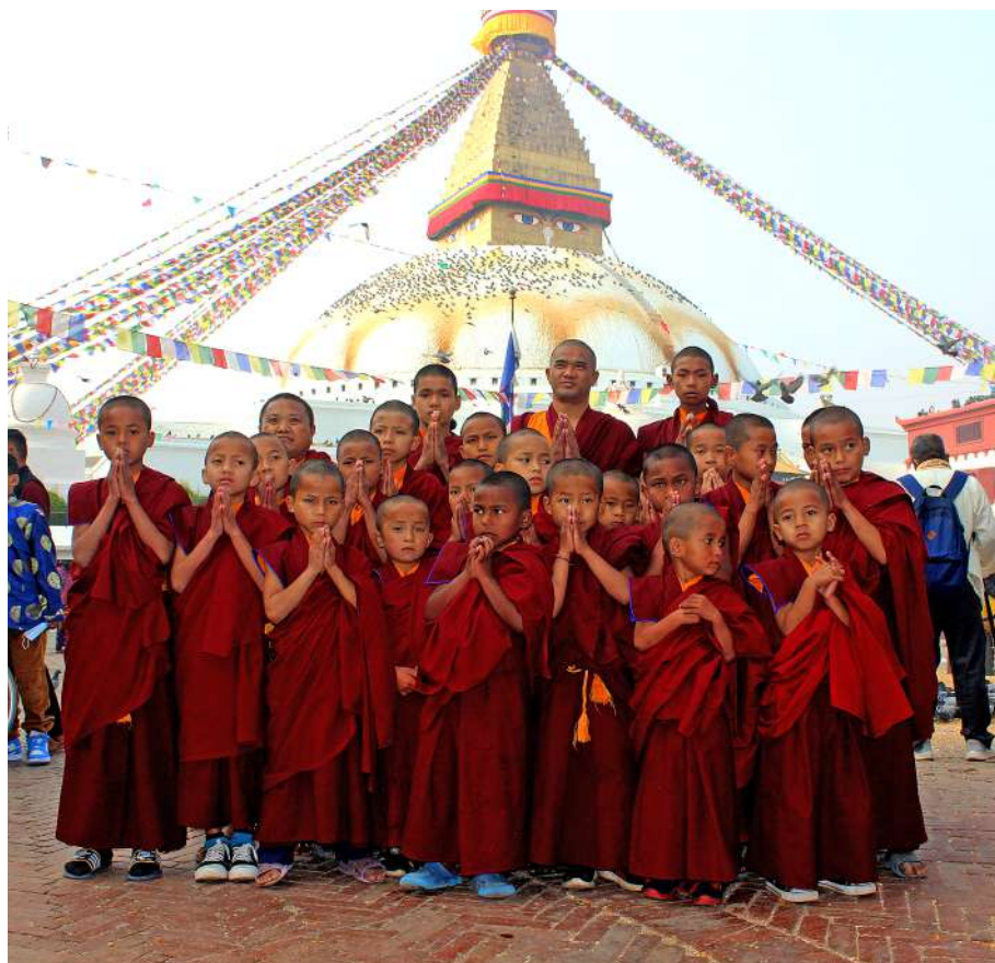
Visiting Boudha Stupa