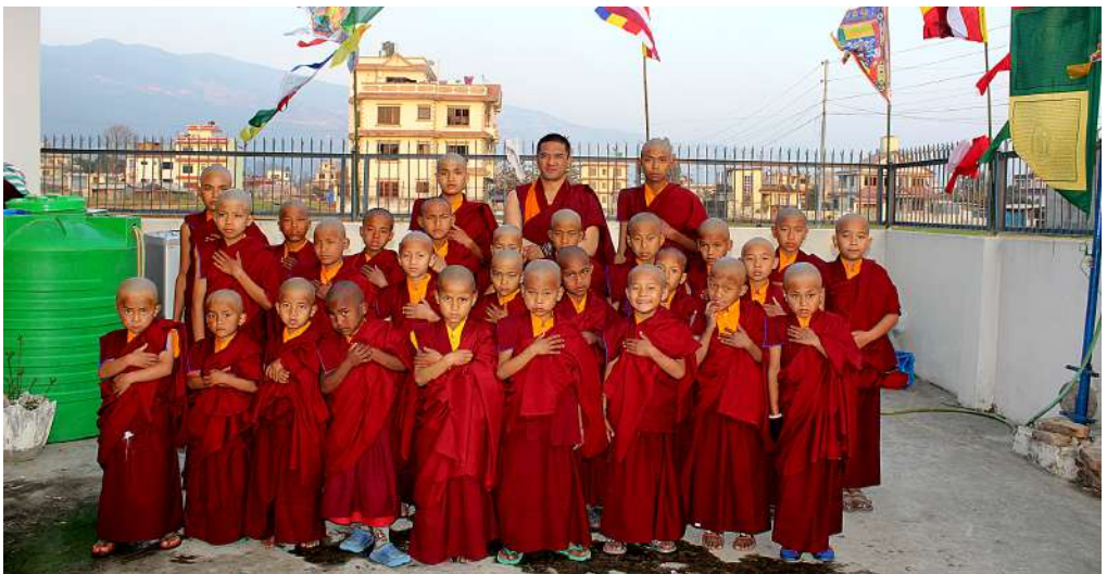
Dharma Students of Khenpo Pema Choephel Foundation