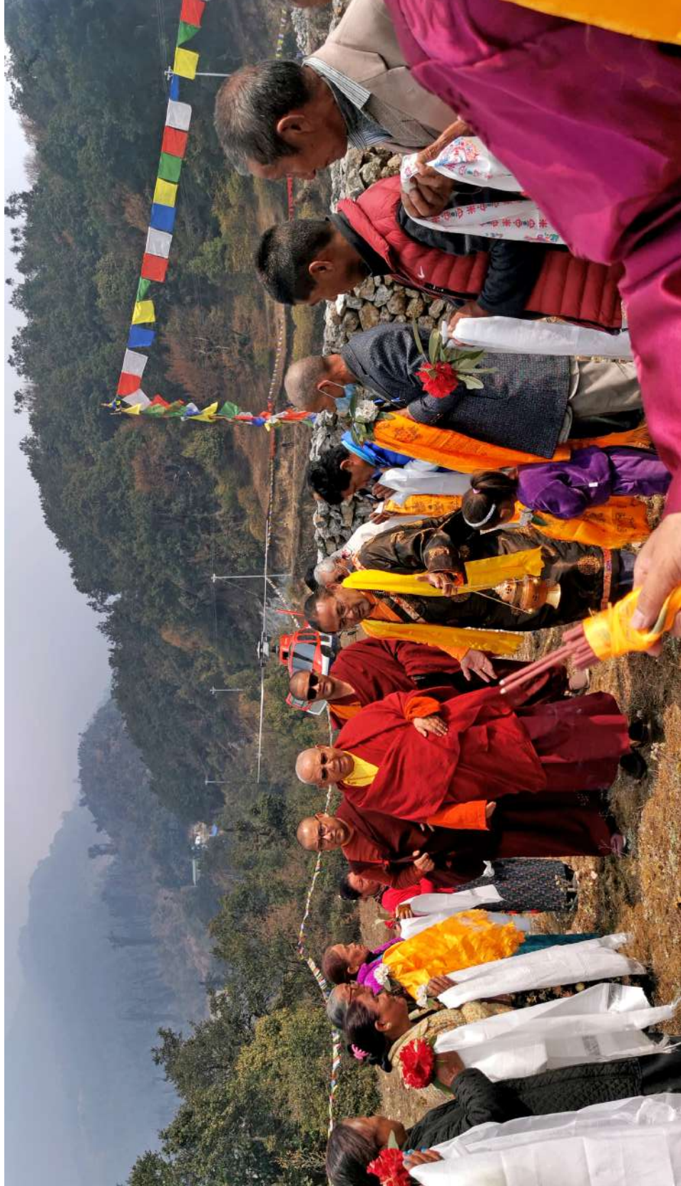
His Eminence Kyabje Rigo Tulku Rinpoche visiting & blessing the site before construction