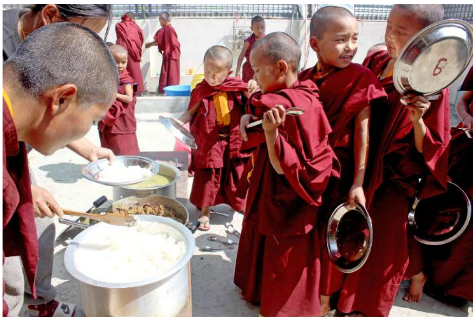
Monks getting ready for lunch