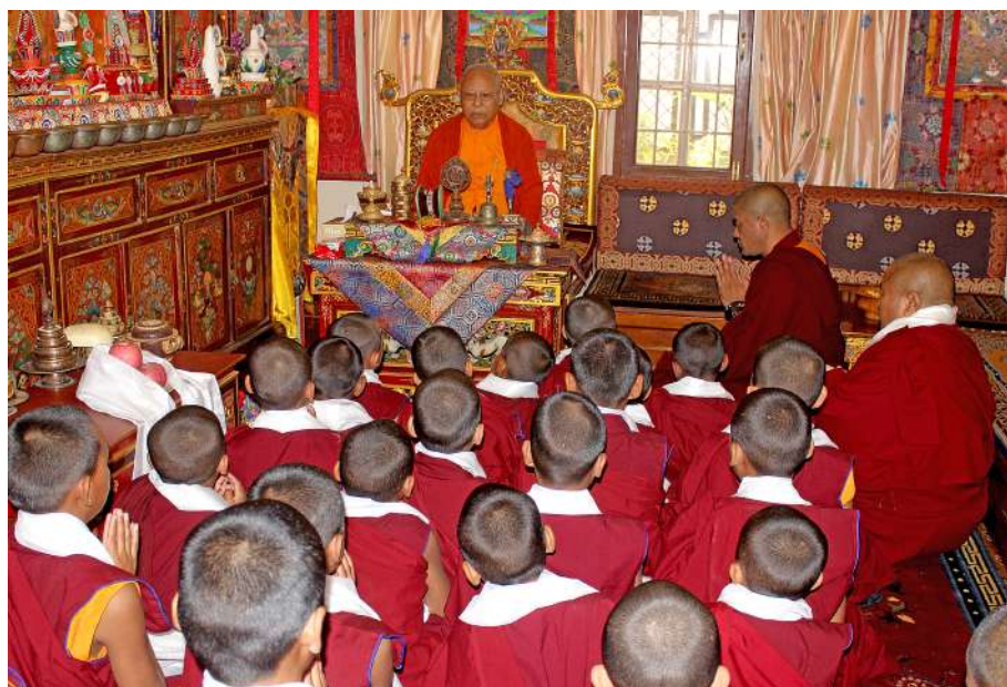
Monks ordination by Kyabje Rigo Tulku Rinpoche